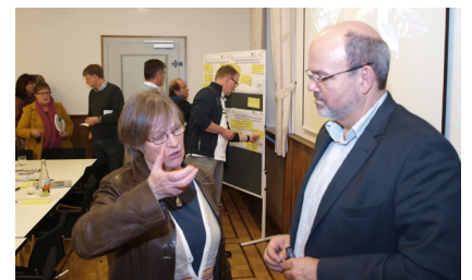
Moderation, Begleitung, Dialog, Konzepte Förderprogramme mit Erfolg

In unserer globalen Welt ist es für den ländlichen Raum wichtiger denn je, lokale Werte und Identifikation in Dörfern und Kommunen zu erhalten. Wenn ortsbildprägende, oft historisch bedeutsame Gebäude, einzigartige Denkmäler, spezifische Gemeinschafts- und Freizeiteinrichtungen, Infrastruktur und das sozial unverzichtbare Ehrenamt aus den Dörfern verschwinden, ist es eigentlich egal wo man lebt, wohnt und arbeitet - das Gefühl „zu Hause“ ist dann nicht mehr wahrnehmbar. Am Ende stehen Leerstand, Anonymität, Landflucht und soziale Verarmung in betroffenen Ortsteilen. Damit es nicht soweit kommt und Kommunen weiter in der finanziellen Lage sind, auf Realisierbarkeit von Visionen, Ideen und Zielen zu bauen, bietet das Landwirtschaftsministerium NRW die Förderung von und mit integrierten kommunalen Entwicklungskonzepten (IKEK) an. Hat man so ein „IKEK“ unter Beteiligung der Bevölkerung erstellt, können geeignete Projekte für Private und Öffentliche gefördert werden. Das interessiert Sie? Dann informieren Sie sich bei ihrem Bauamt, Bezirksregierung oder der Agentur Altrogge wie so was läuft, was gefördert wird und wie hoch die Umsetzungschancen stehen.