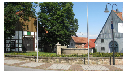
Unverwechselbares Ortsbild prägt Image