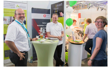
Messestand Agentur Altrogge GATE 2016

7.000 Messebesucher sorgten Anfang Juni für den gelungenen Start in ein innovatives, abwechslungsreiches Veranstaltungsevent mit einmaligem Ambiente am Heimathafen PAD. Drinnen und draußen am Quaxhangar und AirportForum zeigten 100 Aussteller live ihre Produkte, Service und Dienstleistungen für Familie, Technik, Haus & Garten, Gesundheit und Fashion. Das Begleitprogramm begeisterte mit 21 kostenlosen Fachvorträgen und Freizeitaktivitäten von Hubschrauberflügen, Bikerparcours, Bogenschießen bis zur lukullischen Meile. Live dabei: Agentur Altrogge mit Info-Messestand. Weitere Infos und Bilder siehe www.gate2016.de