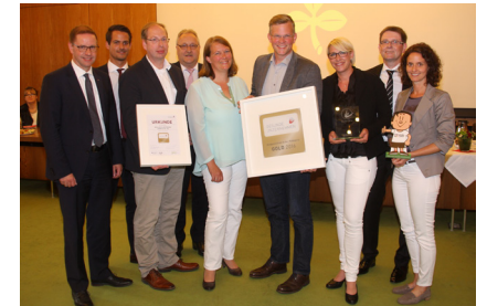
Auszeichnungsfeier im Rathaus Salzkotten: Unternehmer, Bürgermeister, Vertreter Organisation „Gesundes Unternehmen“ sowie Initiator Praenet aus Salzkotten.

Rufen Sie uns einfach an und vereinbaren Sie einen unverbindlichen Termin.