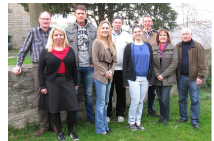
Projekte stehen - jetzt geht's los! Das Team der Dorfwerkstatt Wewelsburg motiviert weitere Akteure für Mitarbeit in Dorfgruppen

Ende Mai präsentierte die 12 köpfige Wewelsburger Dorfwerkstatt der Dorfgemeinschaft (2.200 Einwohner) unter der Begleitung/Moderation der Agentur Altrogge in der bis auf den letzten Platz gefüllten Gaststätte Burgfrieden die erarbeiteten Stärken & Schwächen, Dorfziele und 12 Projektideen für ein zukunftssicheres Burgdorf. Angefangen wird mit der Freizeit-Attraktivität unterhalb der Burg. Weitere Infos siehe www.burgdorf-wewelsburg.de Westenholz (3.800 Einw.) hat eigentlich alles was ein Dorf braucht. Dennoch durfte die Agentur Altrogge bei der Jahressitzung der Bürgerstiftung (120.000€ Stiftungskapital) über „Menschen begeistern - Westenholz gestalten - Lebenswerte sichern“ referieren und sich einer lebhaften Diskussion stellen. Nächste Dorf-Aktivitäten liegen in Weiberg und bei der Touristik Bürener Land an.