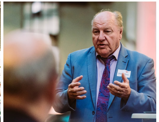
Mittelstand-Frühstück beim SCP • MIG-Vortrag im Roderwerk • Auszeichnung Wirtschaftsfreundliche Kommune