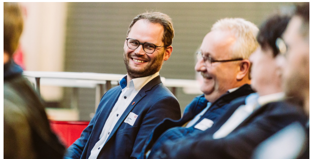
JungerMittelstand zeigt Automatisierung • Fitness mobil • Vorträge nutzen und sich austauschen - das passt.