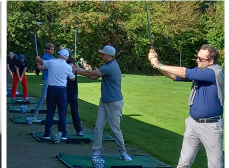
Auszeichnung für erfolgreichen Mittelstand • GolfCUP '23 in Thüle - sich bei Sport und Spaß messen und treffen